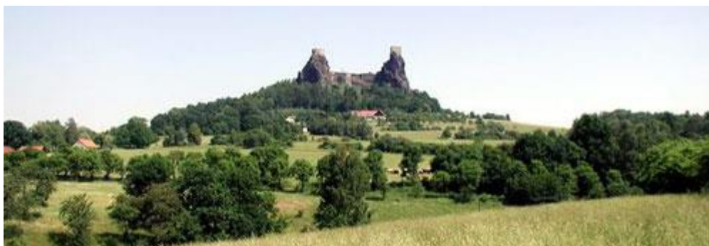
Pohled z kempu

Shromaždiště: Kemp PP, rekreační středisko Palda, Rovensko pod Troskami, 50°31'39.686"N, 15°16'49.916"E